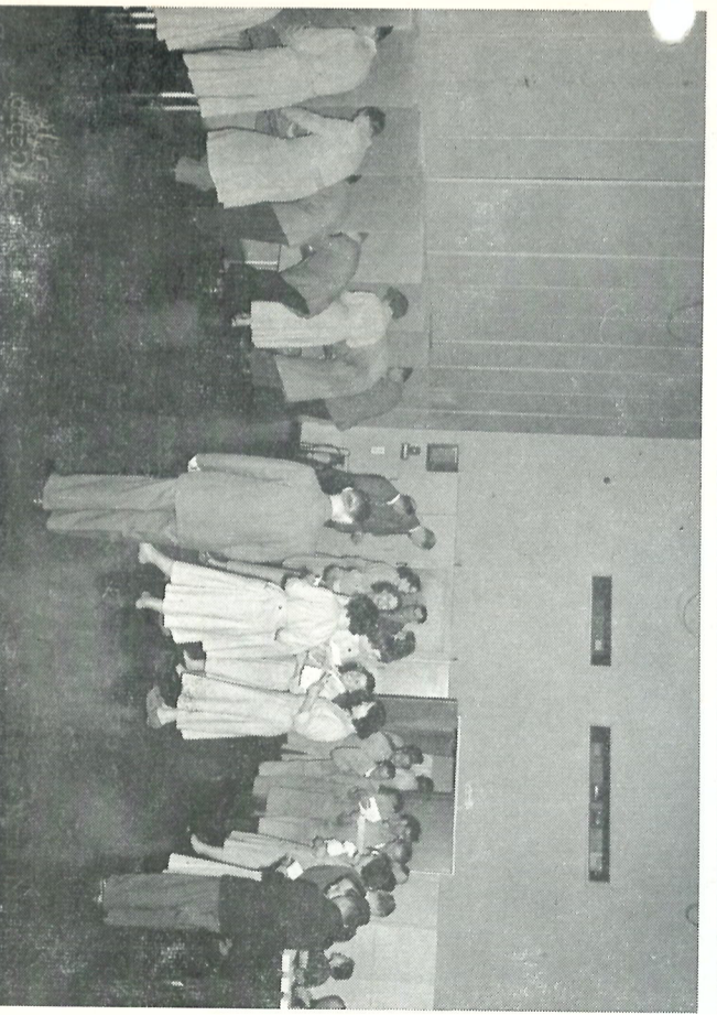
Voor de Ondernemingsraadsverkiezingen bestond aan de Maanweg grote belang- stelling. Voor de volledige uitslag zie pag. 3.

In Utrecht is onze nieuwe fabriek aan de Keulsekade uit een ruime ver- rezen. Overal worden dus activiteiten ontplooid, die tonen, dat wij in een snel groeiend bedrijf werken.